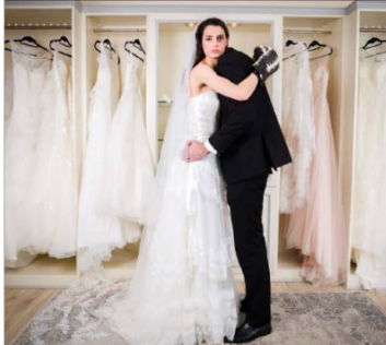
Een van de scènes van Alberto Saleh brengt geweld binnen het huwelijk onder de aandacht. Ook het nachtleven is een belangrijk thema in zijn werk.